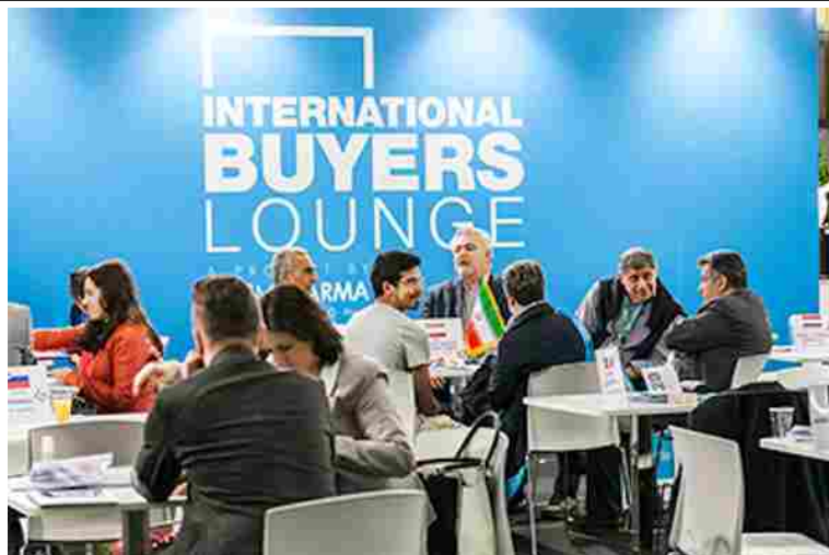
La "International Buyers Lounge" di Cosmofarma 2017

Tecnologia e sperimentazione protagoniste anche dei convegni in manifestazione. Si è parlato di "farmacista aumentato" con QuintilesIMS, che ha analizzato, alla luce delle ultime scoperte tecnologiche, l'apporto della robotica e dell'Intelligenza Artificiale per migliorare il servizio reso dal farmacista. Sono state analizzate anche le opportunità che il mondo digital offre per una farmacia moderna e attenta alle esigenze del cittadino.