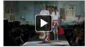
Spring/Summer 2015 Trend: abstract art imposes itself onto the summertime collections