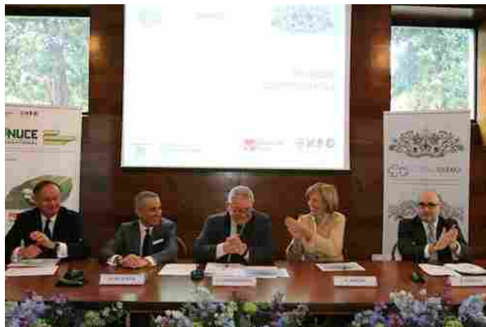
Un momento della conferenza stampa di presentazione di Cosmofarma del mese scorso a Villa Necchi Campiglio, a Milano -

Cosmofarma Exhibition, l'evento di BolognaFiere leader in Europa nell'ambito dei prodotti e servizi legati al mondo della farmacia, ritorna a Bologna dal 17 al 19 aprile 2015 con il patrocinio di Federfarma, la Federazione che raccoglie oltre 16.000 farmacie italiane, con la quale è stata rinnovata la collaborazione per iniziative specifiche rivolte ai farmacisti italiani, e con il sostegno del Gruppo Cosmetici in Farmacia di Cosmetica Italia.