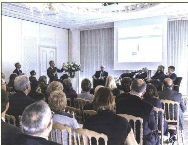
Due momenti della conferenza stampa svoltasi a Milano