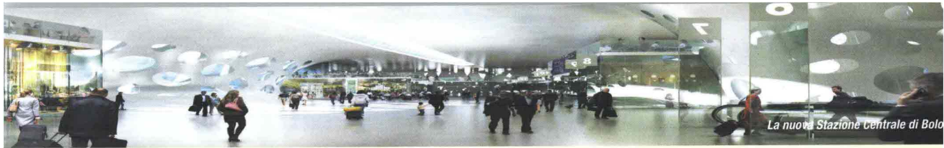
La nuova Stazione Centrale di Bologna