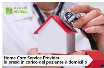
Home Care Service Provider: la presa in carico del paziente a domicilio