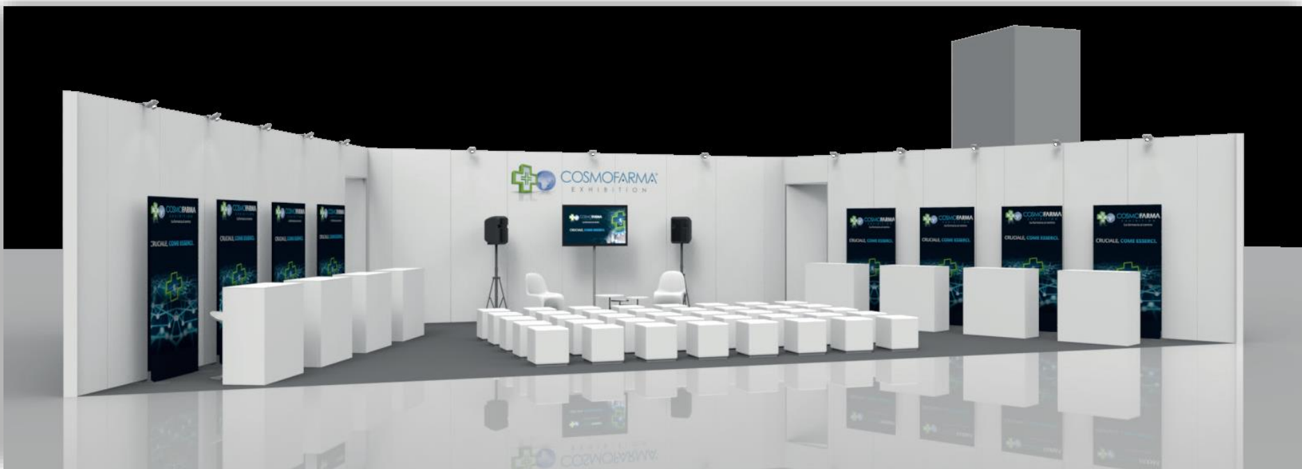
Immagine indicativa Sport Zone: Area espositiva + Area Workshop dedicata