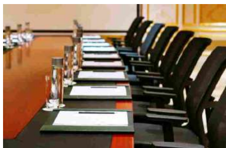
Assemblea società titolari di farmacia,