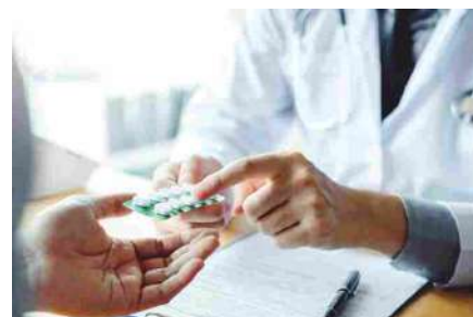
Aderenza terapeutica, come migliorare