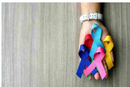
“Insieme per la prevenzione”, al via la