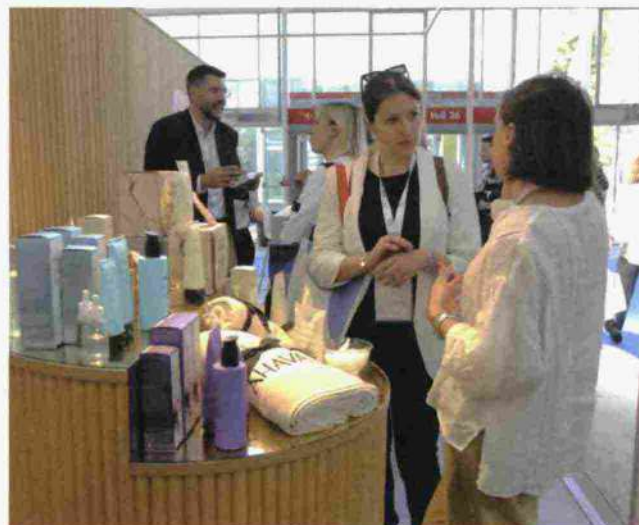
In alto e in apertura, alcune immagini dall'ultima edizione di Cosmofarma