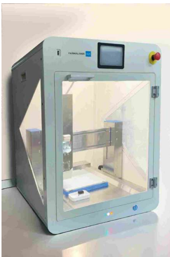
FOTO Stampante 3DForMe